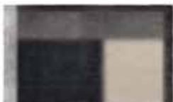
9 LANDFIELD "ECLIPSE" TEPPICH CM 300X300